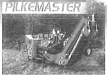
PROCESSEUR À BOIS